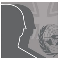
VERTEIDIGUNG & SICHERHEIT