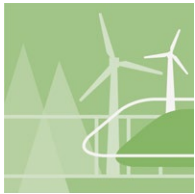
VERKEHR, UMWELT & ENERGIETECHNIK