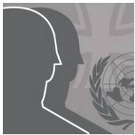
VERTEIDIGUNG & SICHERHEIT