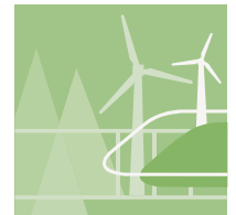
MOBILITÄT, ENERGIE & UMWELT