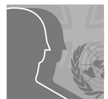
VERTEIDIGUNG & SICHERHEIT